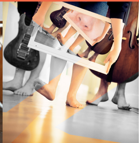
Rivières, Compagnie Prune ; TournOsol, Compagnie Virège et Lenezquicoule, Theater De Spiegel- Lauréats 22/23

DÉCOUVRIR LE FILM DE PRÉSENTATION DU RÉSEAU COURTE-ECHELLE >> ICI <<