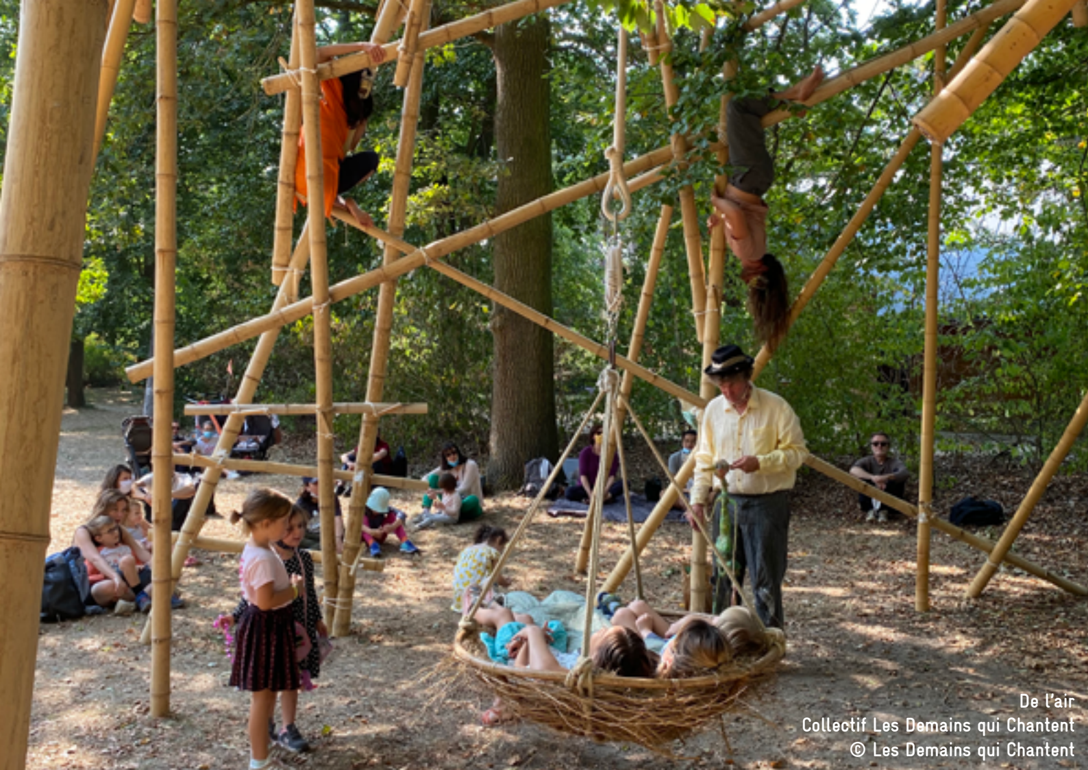
De l'air Collectif Les Demains qui Chantent