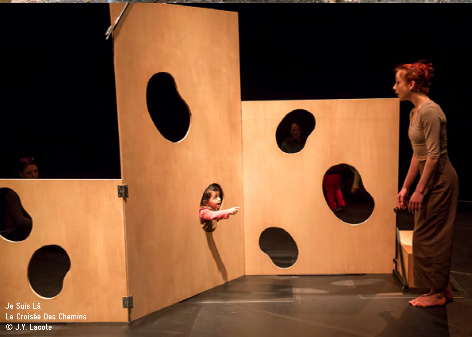
Je Suis Là La Croisée Des Chemins © J.Y. Lacote